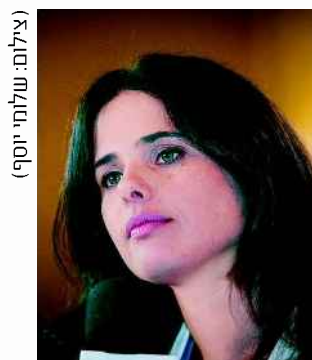
שקד. "יגיעו בשלים"