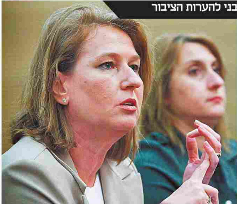
שרת המשפטים ציפי לבני. נזהרת מיצירת תמריץ להימחק מהבורסה הישראלית