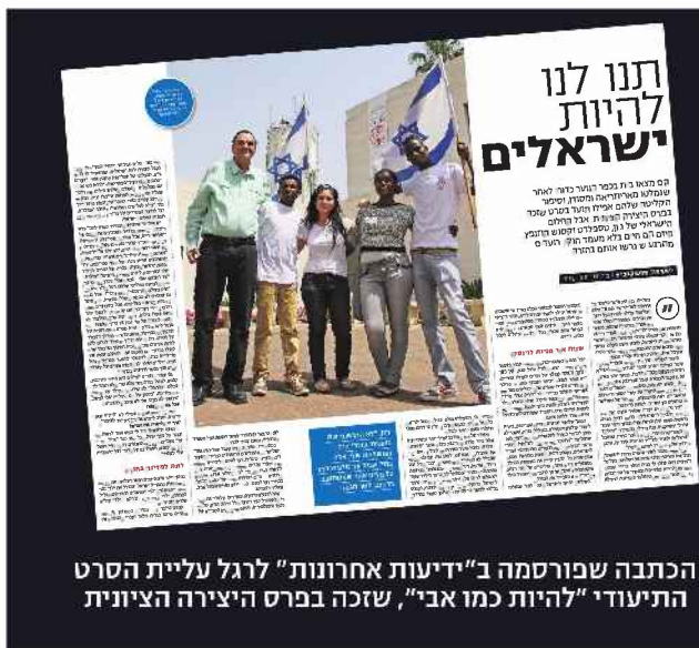
הכתבה שפורסמה ב"ידיעות אחרונות" לרגל עליית הסרט התייעודי "להיות כמו אבי", שזכה בפרס היצירה הציונית

מרשות האוכלוסין נמסר בתגובה: "רשות האוכלוסין וההגירה החלה לזמן לפני כחודש מסתננים, גברים, שאינם בעלי משפחות למרכזו השהייה הפתוח חולות. ככלל, כל זימון של מסתנן למרכזו השהייה הפתוח נבחן עניינית ופרטנית".