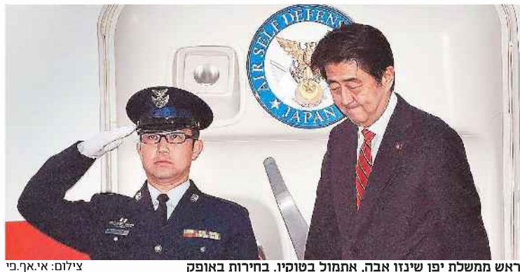
ראש ממשלת יפן שינזו אבה, אתמול בטוקיו. בחירות באופק

כלי והכריז על התוכנית המרחיבה; במסגרתה רכש הבנק המרכזי אג"ח ממשלתיות במיליארדי דולרים, שזרמו אל המשק. הממשלה קיוותה כי שהכריזה עליהן ימריצו את הפעילות הכלכלית במדינה. אלא שמה שקרה בפועל הוא שהיצואנים, שנהגו מהפחות בשער היין, הפנו את הכסף שזרם לכיסיהם אל הבורסה היפנית, וזו פרחת בעקבות הצעדים המרחיבים - על חשבון השיקעה בעסקיהם ושיפור התנאים והמשיכורות של העובדים במשק. "אחת הבעיות בהרחבה הכמותית היא תיעול הכסף: צריך להביט שיה שרמתו לא נשארת ברמה של