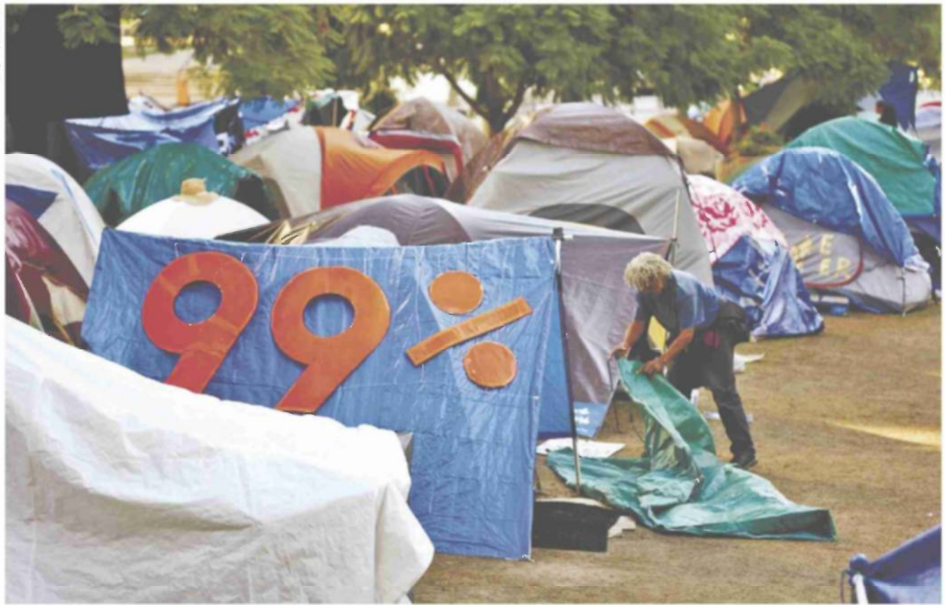
מאהל של פעילי תנועת Occupy Wall Street בלוס אנג'לס. "אנחנו זקוקים לתנועה עממית חזקה ומאוחדת"

לא הצלחנו להתקדם בכל מה שנוגע למחוקקים. הם בכלל לא ידעו שמתנהל דיון בעניין הזה, ואם כן - הם לא הכירו בו. המערכת הופכת את זה לבלתי אפשרי לשמוע את הצד השני, מפני שלצד השני אין כסף להיות במערכת. לא רצייתי לבלות את המשך הקריירה שלי בלהחזיר את הטיעונים למי שכבר מקשיב. רצייתי לעבור למשימה הקשה יותר.