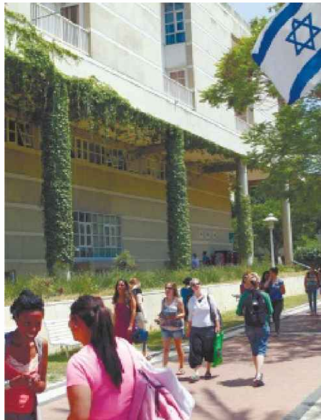
אוניברסיטת בר-אילן. למצולמים אין קשר לכתבה

הנתונים מתייחסים לכ-926 מתמחים ב-2013-2015. הם כור ללים מתמחים בפרקליטות המדינה (אורחי, פלילי, חוקתי ומינהלי, כלכלי, דיני עבודה, בינלאומי); מחוז תל אביב (אורחי, פלילי, מיסוי וכלכלה); מחוז מרכז; מחוז ירושלים (אורחי ופלילי); מחוז דרום (אורחי ופלילי) ומחוז חיפה (אורחי ופלילי). הנתונים מראים