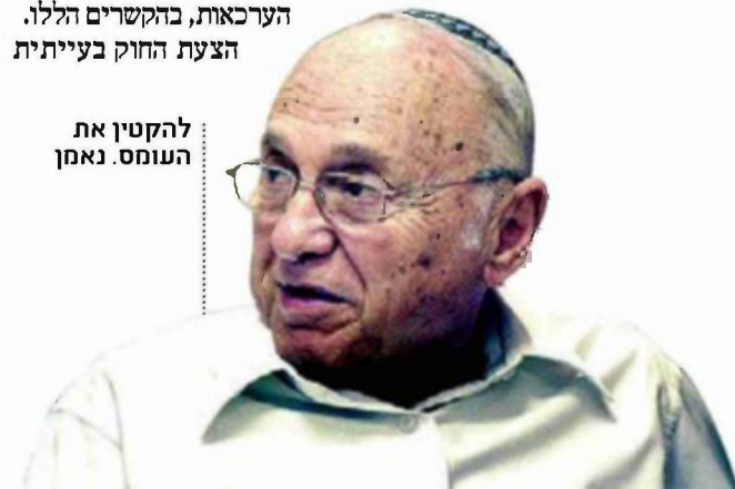
להקטין את העומס. נאמן

מטעם נוסף. היא חוסמת, באופן מעורר תהייה, מינוי של משפטנים מעולים לתפקיד בורר בבוררות חובה. לפי ההצעה יכול להתמנות לבורר רק אדם שעסק בפועל בעריכת דין. יוצא אפוא, שאדם, שעסק בשפיטה, בתפקיד משפטי אחר בשירות המדינה, או בהוראה ומחקר משפטי